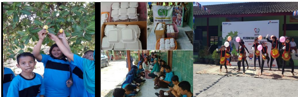
Gambar 2. Peserta Didik belajar di luar kelas, infaq untuk GNJ (Gerakan Nasi Jum'at), pentas seni tari berlatih Kemandirian, Keterampilan dan Rajin Ibadah

difokuskan kepada pengembangan potensi peserta didik secara maksimal, sehingga peserta didik “terampil” dalam menjalani perkembangannya dimana program keterampilan yang telah dilaksanakan di SLB N Boyolali antara lain Membuat, Menjahit/Tata Busana, Hidroponik, Tata boga dan penjualan dan Salon; (3) rajin ibadah dimana program peningkatan keimanan dan ketaqwaan menjadi program terpadu dalam pembelajaran, dengan tujuan peserta didik rajin dalam beribadah baik di sekolah maupun di rumah. Program peningkatan keimanan meliputi Sholat Dhuha berjamaah, Pengajian Guru dan peserta didik beserta walinya, Jamaah sholat Dzuhur, Kegiatan Pesantren Kliat.