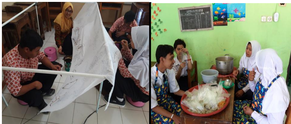
Gambar 1. Kegiatan pembelajaran membuatik dan tata boga di Sekolah melatih keterampilan dan kemandirian Peserta Didik

diselenggarakan pada awal bulan Juni 2019. Rapat sekolah di ikuti oleh Komite sekolah, Guru dan Karyawan, serta Wali murid. Rapat dengan agenda mendengarkan dan sambung rasa antara berbagai pihak dan menggali sejauh mana hak yang dan kewajiban yang sudah dilaksanakan, serta meminta saran dan pendapat berbagai pihak untuk kemajuan sekolah. Rapat sekolah selanjutnya diselenggarakan pada pertengahan semester pertama setelah disusunnya Manajemen Taman Terindah oleh kepala sekolah. Rapat sekolah yang selanjutnya membahas tentang sosialisasi Manajemen Taman Terindah kepada guru dan karyawan, serta wali murid.